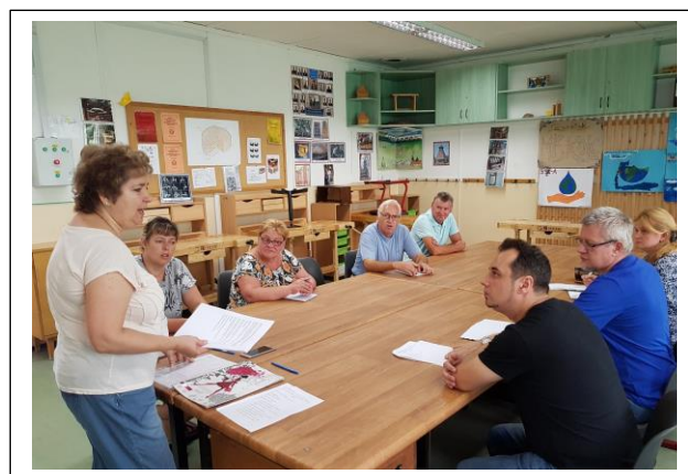
Munkaközösségi tagok - megbeszélés