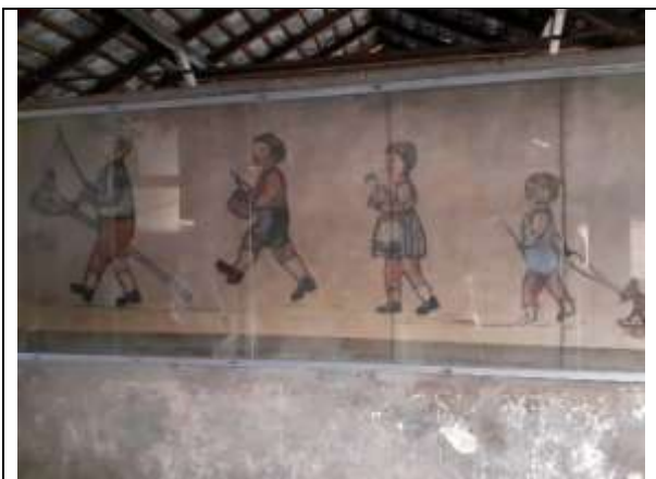
Gyerekrajzok a BIRKENAU táborból